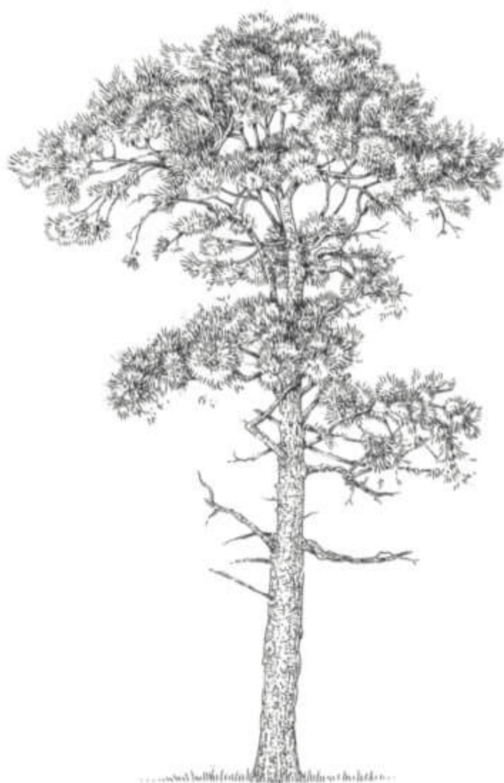
Pinul de pădure, Pinus sylvestris